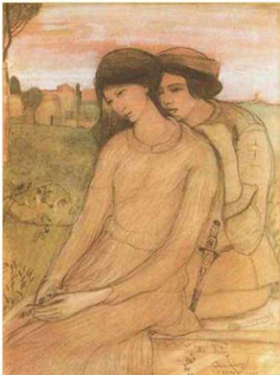
Gulácsy Lajos (1882–1932): Paolo és Francesca