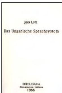
1988-as kiadású Sprachsystem

A Das ungarische Sprachsystem újragondolása és átdolgozása volt az a terv, amellyel Lotz a maga által kitűzött célt, a magyar nyelvészet korszerűsítését szolgáltni akarta. Korai halála megakadályozta abban, hogy tervét teljes egészében megvalósítsa, de a nyelvtanának átdolgozott részeiből fölsejlik „torzó” is monumentális, amellet rendkívül tanulságos. Jellemző Lotzra, hogy bár figyelmét mindig a – többé-kevésbé – kiszámítható (szabályos) „egészre” fordította, a kidolgozott „részek” majdnem mindig a kivételekről szólnak. Közhelynek számít, hogy „a kivétel erősíti a szabályt”. A nyelvre vonatkoztatva ezt úgy pontosítanám, hogy „a kivétel tartja életben a rendszert”, legfőképpen azért, mert annak van igazán hírértéke. Lotz vélhetőleg a magyar grammatika kivételeiből kiindulva építette volna föl újra nyelvtanát. E sejtésemet személyes tapasztalatomra is alapozom: 1972 késő nyarán, Szegeden, a Magyar Nyelvészek II. Nemzetközi Kongresszusán tartott nagy sikerű előadásának tárgya ugyanis éppen egy ilyen kivétele volt a magyar nyelvnek. Előadásának szövege nyomtatásban nem jelent meg, így gyarló emlékezetemre hagyatkozhatom csupán. Egy székely nyelvjárásban ugyanis Lotz János infixumra talál, azaz olyan szóbelseji kötött toldalékokra (ragra vagy jelre), amely az illető szó mondattani szerepét határozza meg. A toldalékoknak ez a csoportja azidáig teljesen ismeretlen volt a magyarban, ellentétben