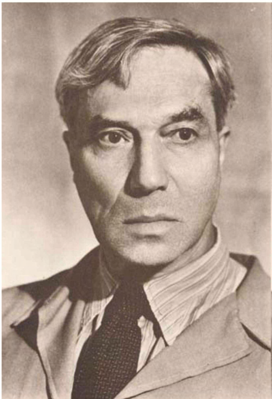
Borisz Paszternak (1890–1960) Nobel-díjat egy regényéért kapott, az irodalomtörténet mégis költőként tartja számon.